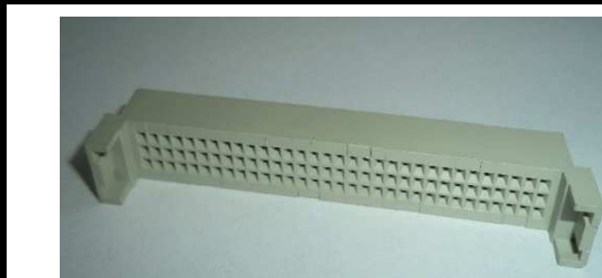
Alojamento Din 96