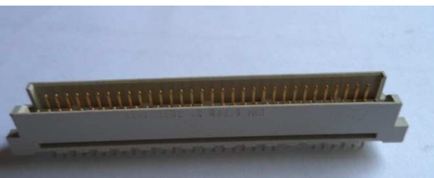
DIN 96 pinos M Foto 3