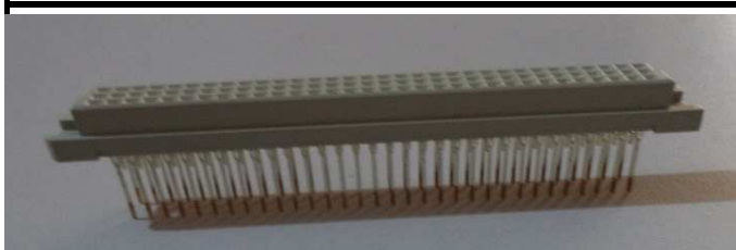
DIN 96 pinos Femea Wire Wrap Foto 4