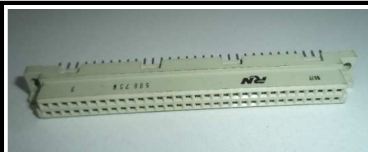
DIN 64 pinos Femea solda placa