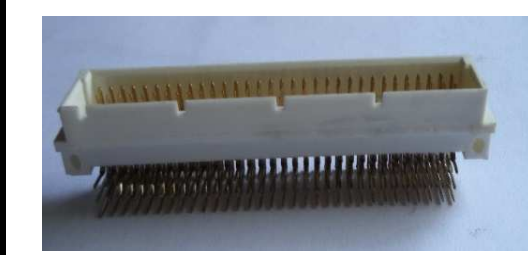
DIN 96 pinos macho 90°